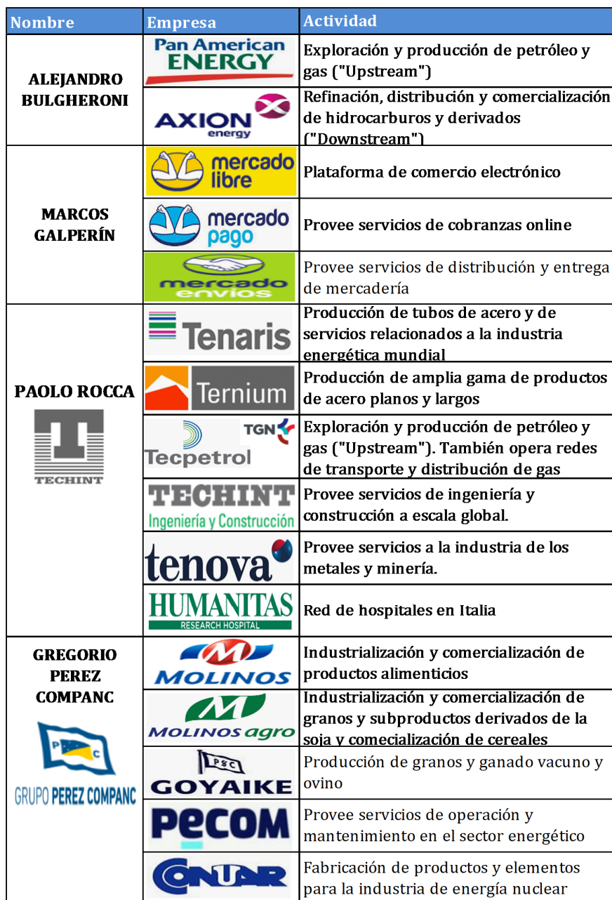
Cuadro N° 3: Grupos económicos y participaciones accionarias de las principales 10 fortunas de Argentina. Año 2020.