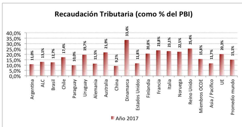
Gráfico N ° 1: Recaudación Impositiva, como % del PBI. Países seleccionados.